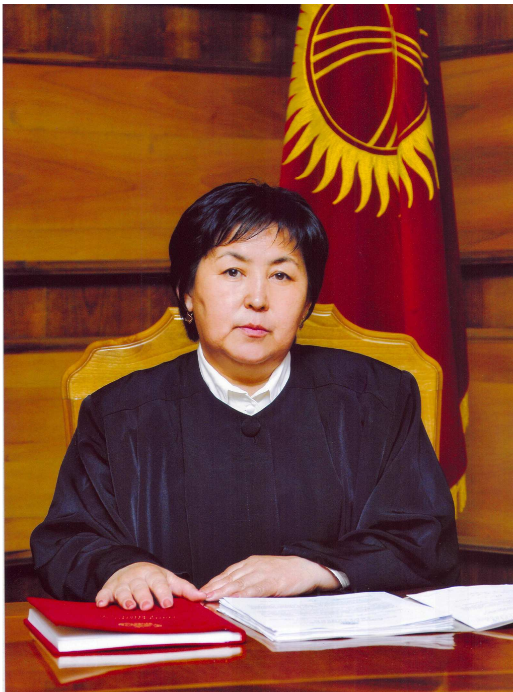
СЫДЫКОВА СВЕТЛАНА КАЛДАРБЕКОВНА 2008-жылдан бери Кыргыз Республикасынын Конституциялык сотунун Тирагасы