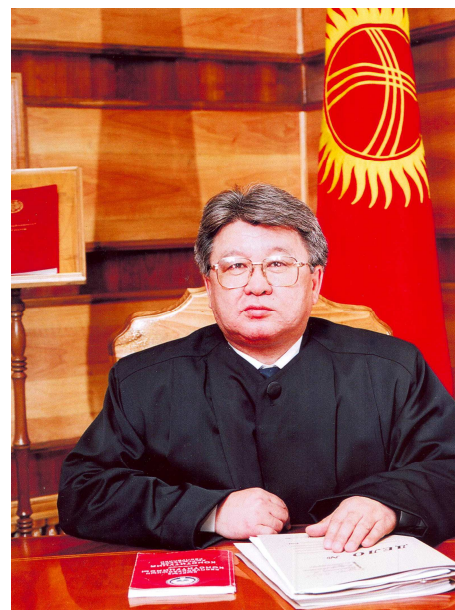
ЭСЕНКАНОВ КАЧЫКЕ 1996-жылдан бери Кыргыз Республикасынын Конституциялык сотунун судьясы