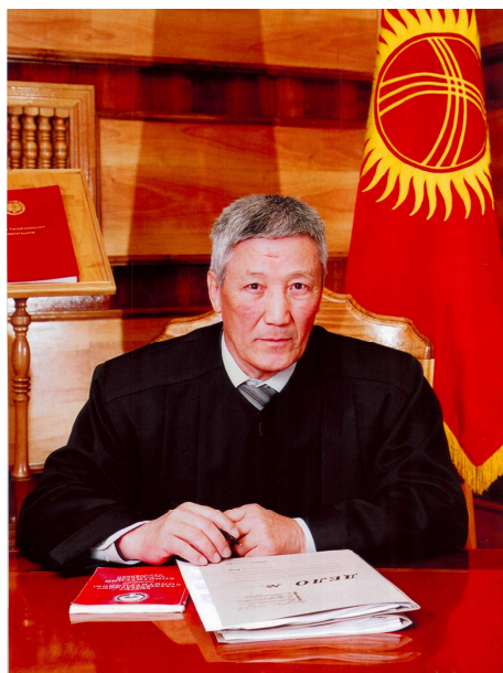
СУТАЛИНОВ АБДЫБЕК АСАНКУЛОВИЧ 1996-жылдан бери Кыргыз Республикасынын Конституциялык сотунун Тырагасынын орунбасары