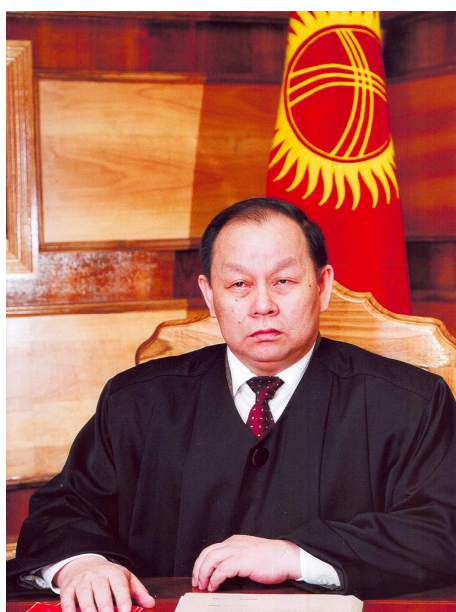
АБДУГАПАРОВ АБИБУЛА АБДУГАПАРОВИЧ 2008-жылдан бери Кыргыз Республикасынын Конституциялык сотунун судьясы