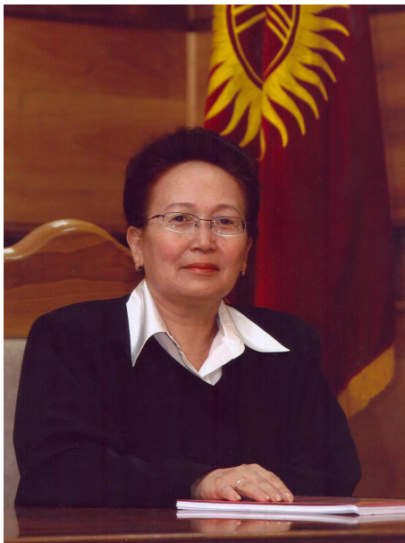
КУРБАНОВА ЧИНАРА ДЖАЛИЛОВНА 2007-жылдан бери Кыргыз Республикасынын Конституциялык сотунун судьясы