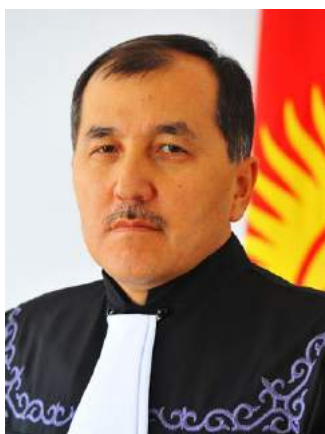
Председатель Мамыров Эркинбек Тобокелович