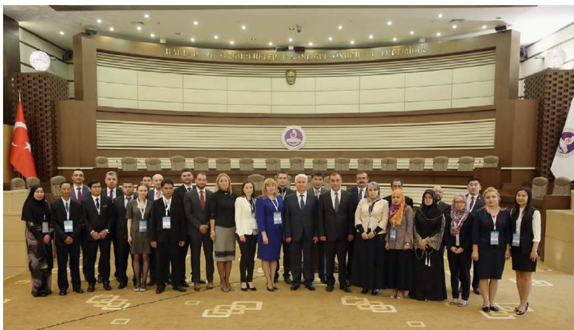
4-я Летняя школа

По итогам встречи стороны выразили заинтересованность и готовность в дальнейшем сотрудничестве в целях совершенствования IT инфраструктуры Конституционной палаты Верховного суда Кыргызской Республики.