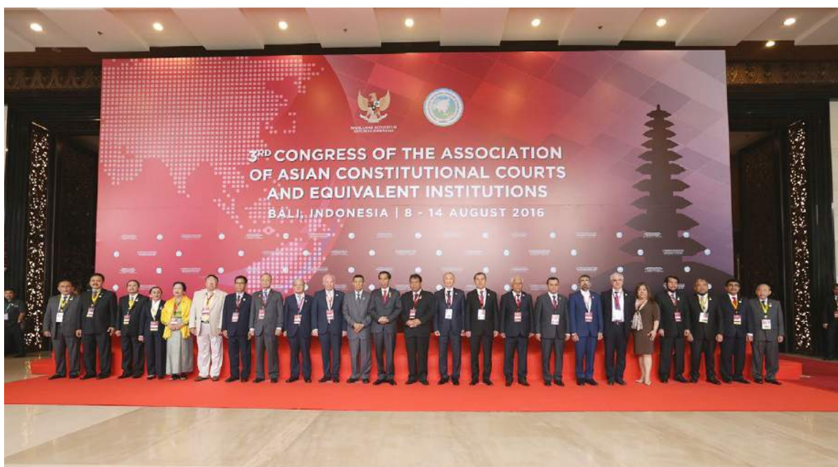
3-й Конгресс Ассоциации азиатских конституционных судов и эквивалентных институтов (Бали-Индонезия, 8-14 августа 2016 года)

В 2016 году Конституционная палата продолжила сотрудничество в качестве полноправного члена Всемирной конференции по конституционному правосудию, Конференции органов конституционного контроля стран новой демократии и Ассоциации азиатских конституционных судов и эквивалентных институтов (ААКС). Статус полноправного члена указанных организаций способствует широкому взаимодействию Конституционной палаты с органами конституционного контроля стран-членов, обмену знаниями и опытом работы по вопросам отправления конституционного правосудия, а также защиты фундаментальных прав и свобод человека и гражданина.