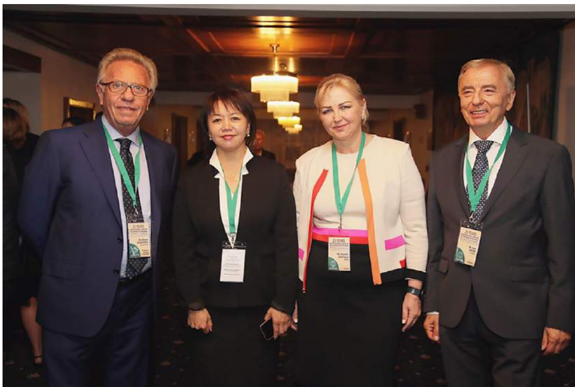
Международная конференция «Защита основных прав граждан и национальная безопасность в современном мире. Роль конституционных судов», по случаю 25-й годовщины Конституционного суда Болгарии (София, 21-22 сентября 2016 года)