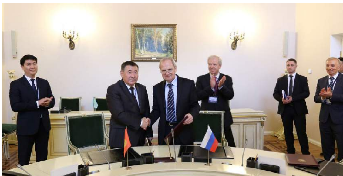
Подписание Меморандума о сотрудничестве между Конституционной палатой и Конституционным Судом Российской Федерации (Санкт-Петербург, 17 мая 2016 года)