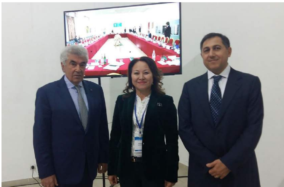
Ереванская международная конференция (Ереван, 20-23 октября 2016 года)