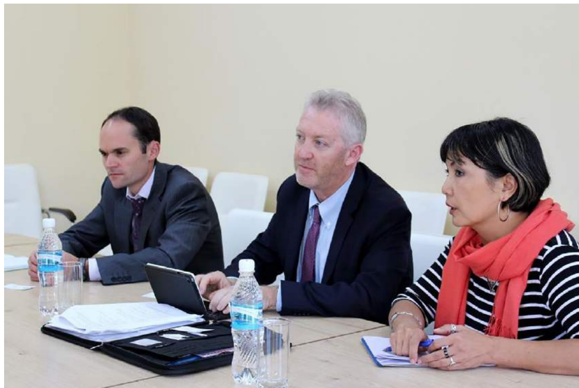
Встреча со старшим советником по вопросам верховенства права Агентства США по международному развитию (USAID) Эндрю Соломоном (Бишкек, 5 октября 2016 года)