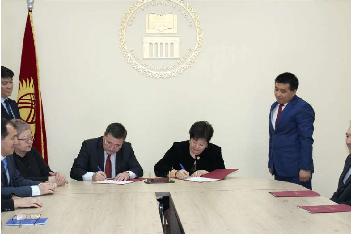
Подписание меморандумов о сотрудничестве между Конституционной палатой и вузами г. Бишкек (Бишкек, 22 апреля 2016 года)