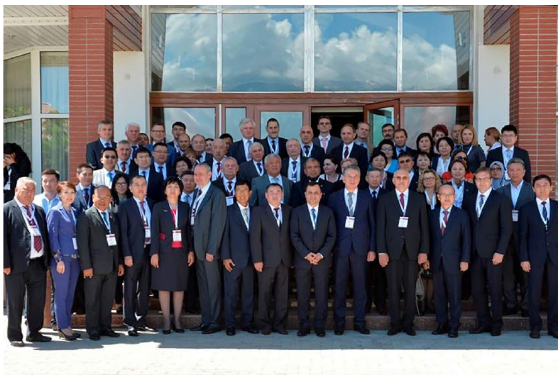
Международная конференция «Место и значение органа конституционного контроля в эффективном функционировании системы сдержек и противовесов между ветвями государственной власти» (Иссык-Куль, 9-10 июня 2016 года)