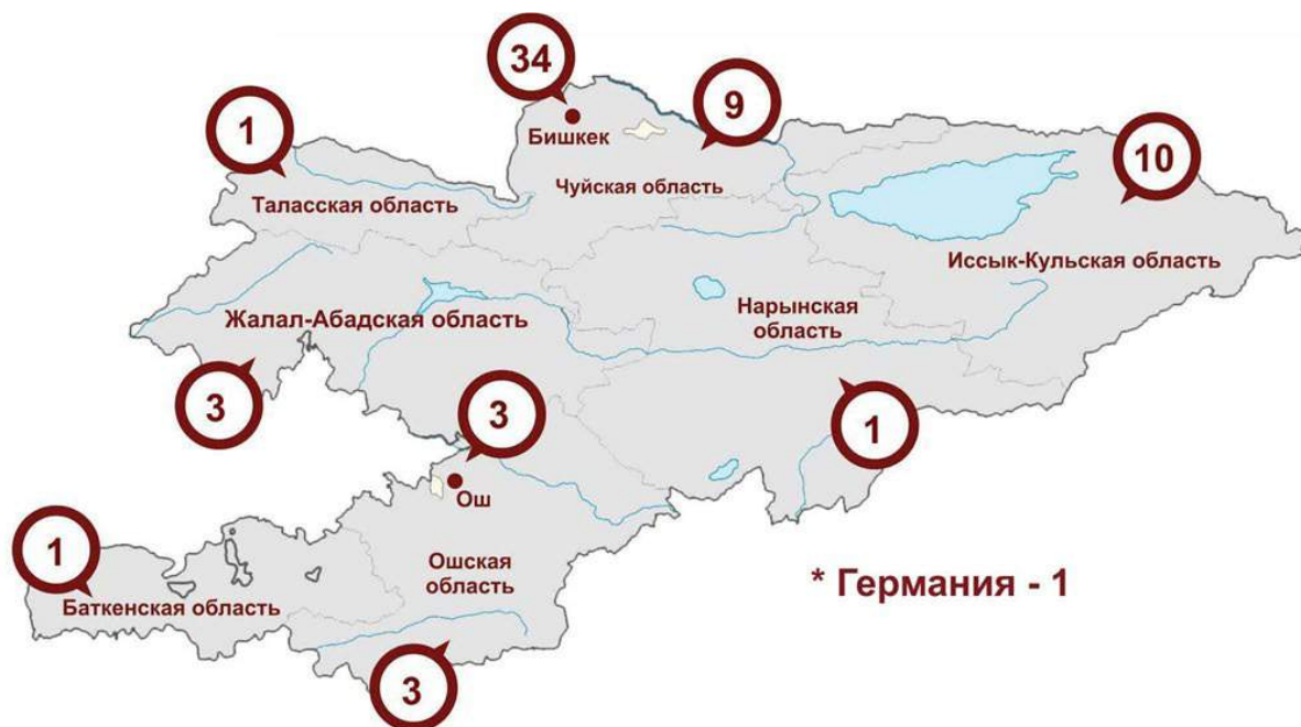
Диаграмма 2. Региональный состав

От физических лиц поступило 48 ходатайств от 56 человек, в данное количество были включены индивидуальные и коллективные обращения граждан.