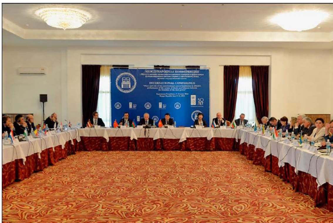
Международная конференция «Место и значение органа конституционного контроля в эффективном функционировании системы сдержек и противовесов между ветвями государственной власти» (Иссык-Куль, 9-10 июня 2016 года)