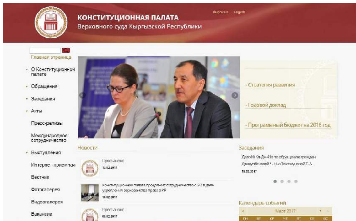
Официальный сайт Конституционной палаты Верховного суда Кыргызской Республики