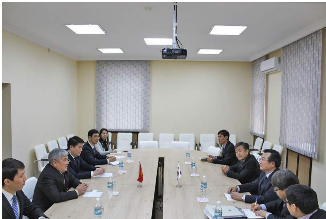
Встреча с делегацией Конституционного суда Республики Корея (Бишкек, 9 декабря 2016 года)