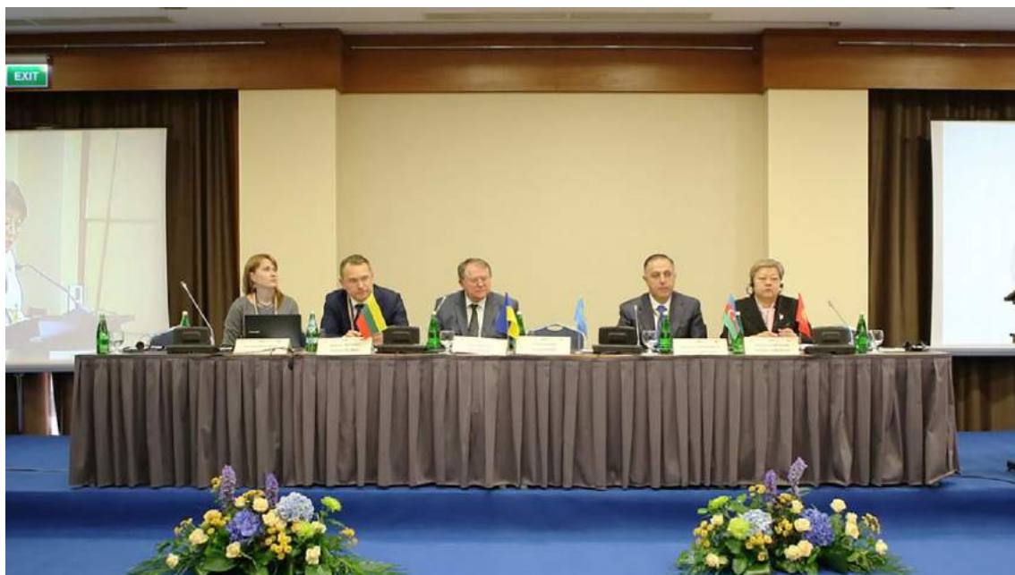
Международная конференция «Конституционный контроль и процессы демократической трансформации в современном обществе», по случаю 20-летия Конституционного Суда Украины (Киев, 7-8 октября 2016 года)